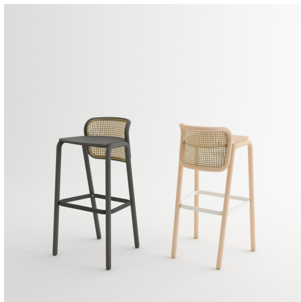
Sgabello in legno di faggio curvato con sedile in multistrato. Schienale rivestito con canna d'India.

Stool in bent beechwood with plywood seat and the back covered in Indian cane.